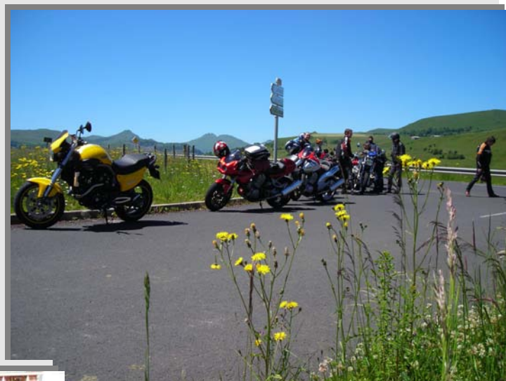
Une des nombreuses haltes dans une oasis Auvergnate: un moment très apprécié !

Notre verte et chaude Auvergne ... en attendant les égarés, comme d'habitude !