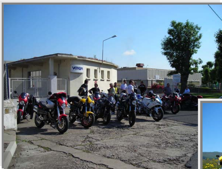
Notre célèbre lieu de rendez-vous: le point 0 de la capitale de Voxanie.

L'après-midi, nous sommes repartis sous le cagnard en direction de La Chaise Dieu, en passant par Langeac et Allègre. Le plaisir de se déplacer sur ces superbes routes étant un peu gâché par la présence de flaques de goudron fondu et de gravillons. Nous en avons profité pour semer les retardataires qui ont finalement atteint La Chaise Dieu avant nous.