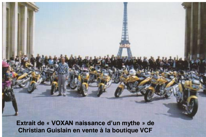
Extrait de « VOXAN naissance d'un mythe » de Christian Guislain en vente à la boutique VCF

Sylvain, Roadster 1999 n°100, « André Verchuren Réplica », VCF 002, humanoïde tripode.