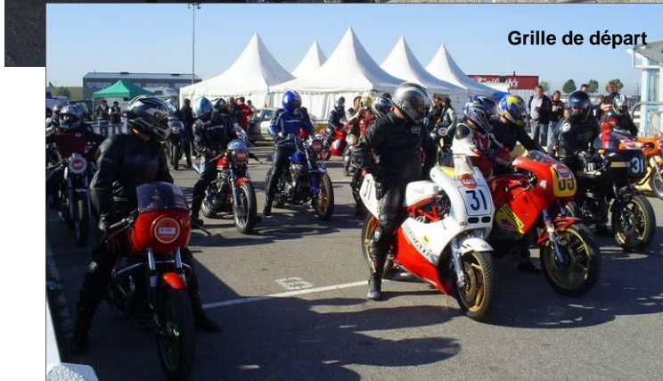
Grille de départ