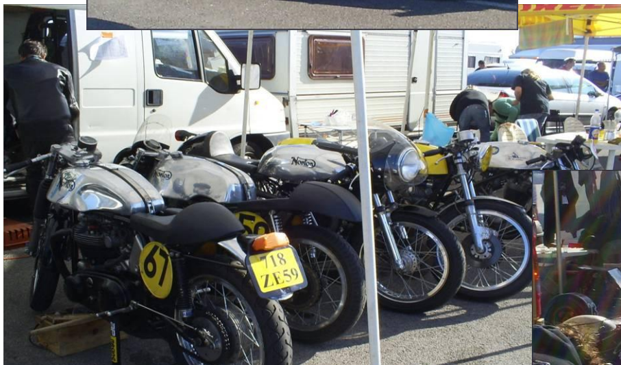
Belle brochette de motos coursifiées