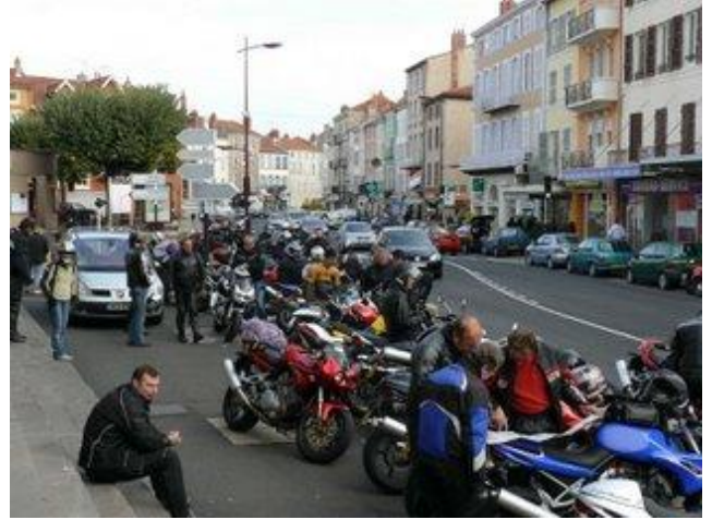
Les Voxan ont envahi le centre ville d'Issoire, comme d'habitude

Les premiers à arriver dès le vendredi en fin d'après-midi se sont retrouvés une cinquantaine autour d'un buffet composé de spécialités régionales. Le lendemain matin, ils étaient conviés à se rendre à la maison des associations d'Issoire (ville où est implantée l'usine Voxan) par les petites routes, et y étaient rejoints par une trentaine de participants supplémentaires.