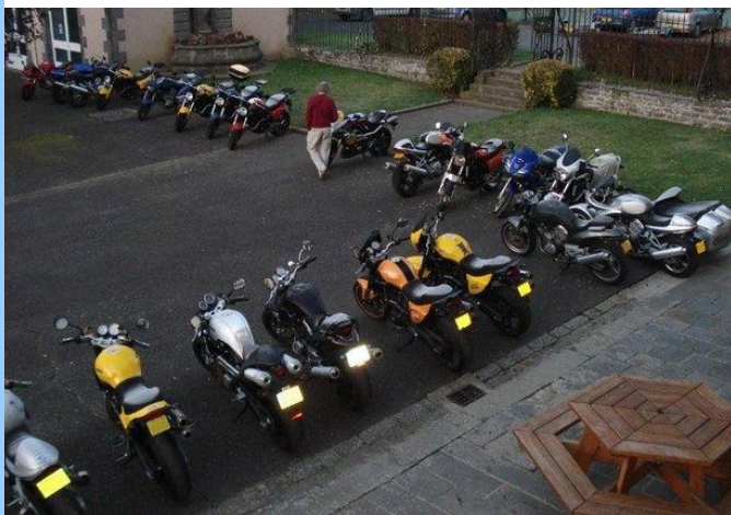
Une belle brochette de Voxan dans la cour du château de Theix