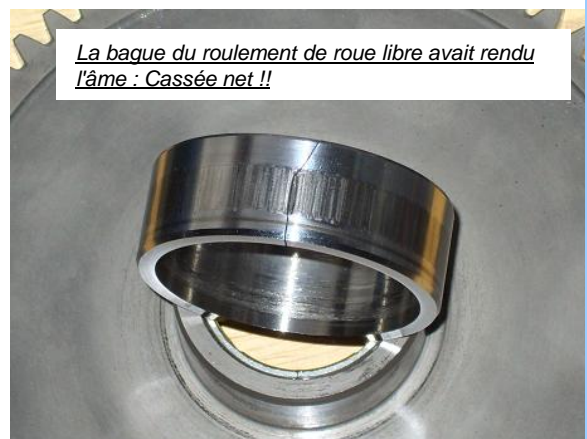
La bague du roulement de roue libre avait rendu l'âme : Cassée net !!