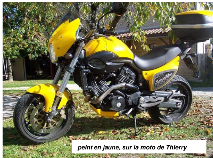
peint en jaune, sur la moto de Thierry