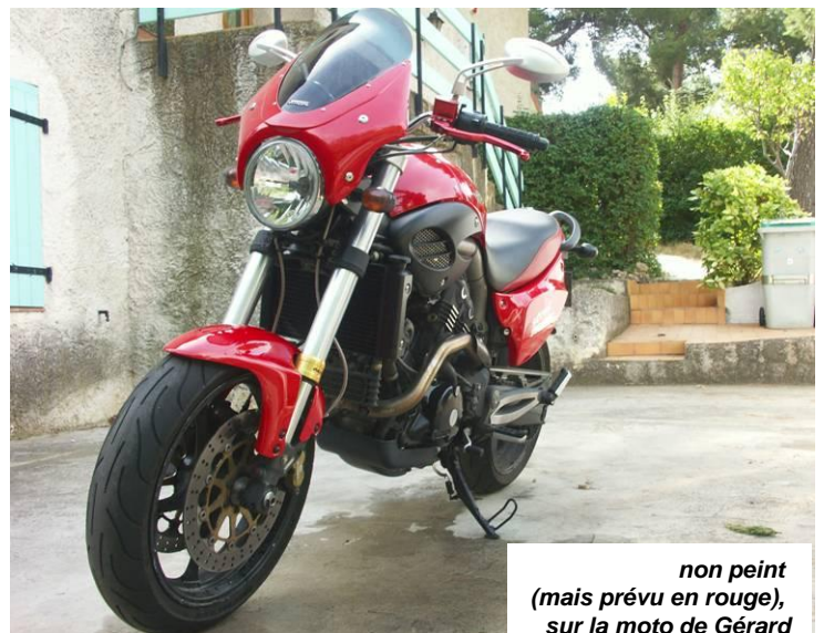
non peint (mais prévu en rouge), sur la moto de Gérard