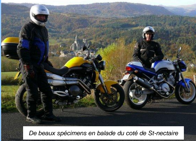
De beaux spécimens en balade du côté de St-nectaire

Vend 2 VOXAN Café Racer Officielles 2001, ensemble ou séparément.