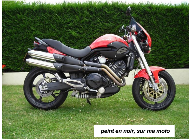
peint en noir, sur ma moto

ou scraty.vcf@neuf.fr ou Scraty en mp sur le forum. Scraty