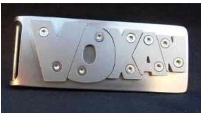
CHOIX « C »