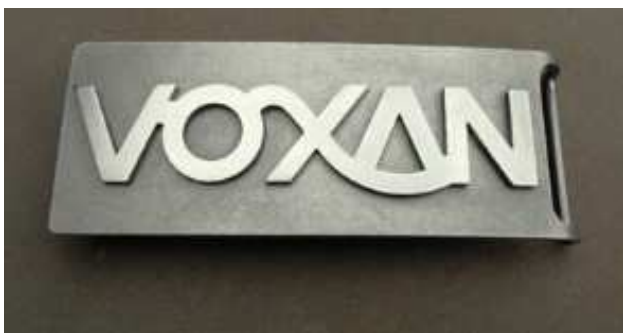
CHOIX « A »