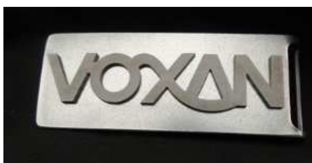
CHOIX « B »