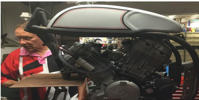
Le moteur présenté dans le cadre Norton