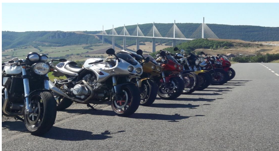
Les Voxans à l'honneur avec le viaduc de Millau derrière

C'est une vraie mère poule ce CF87, qui s'occupe de nous trouver les bonnes tables et nous fait des roadbooks tip-top.