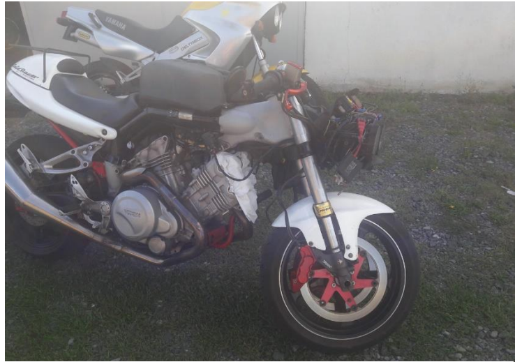
Le café chez Motovox