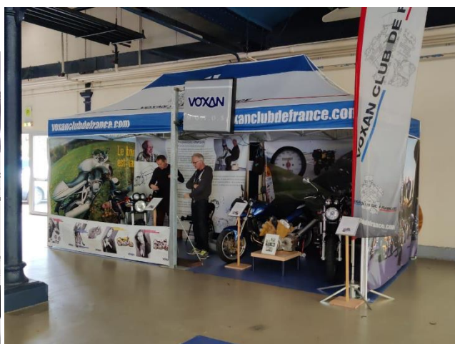
Une belle brochette de Voxanistes

Nous avons eu la visite de plusieurs de nos membres durant ses trois jours. Les curieux, les connaisseurs, les pressés, les « j'ai un problème, vous pouvez m'aider » et les jamais contents ont défilé durant ce salon.